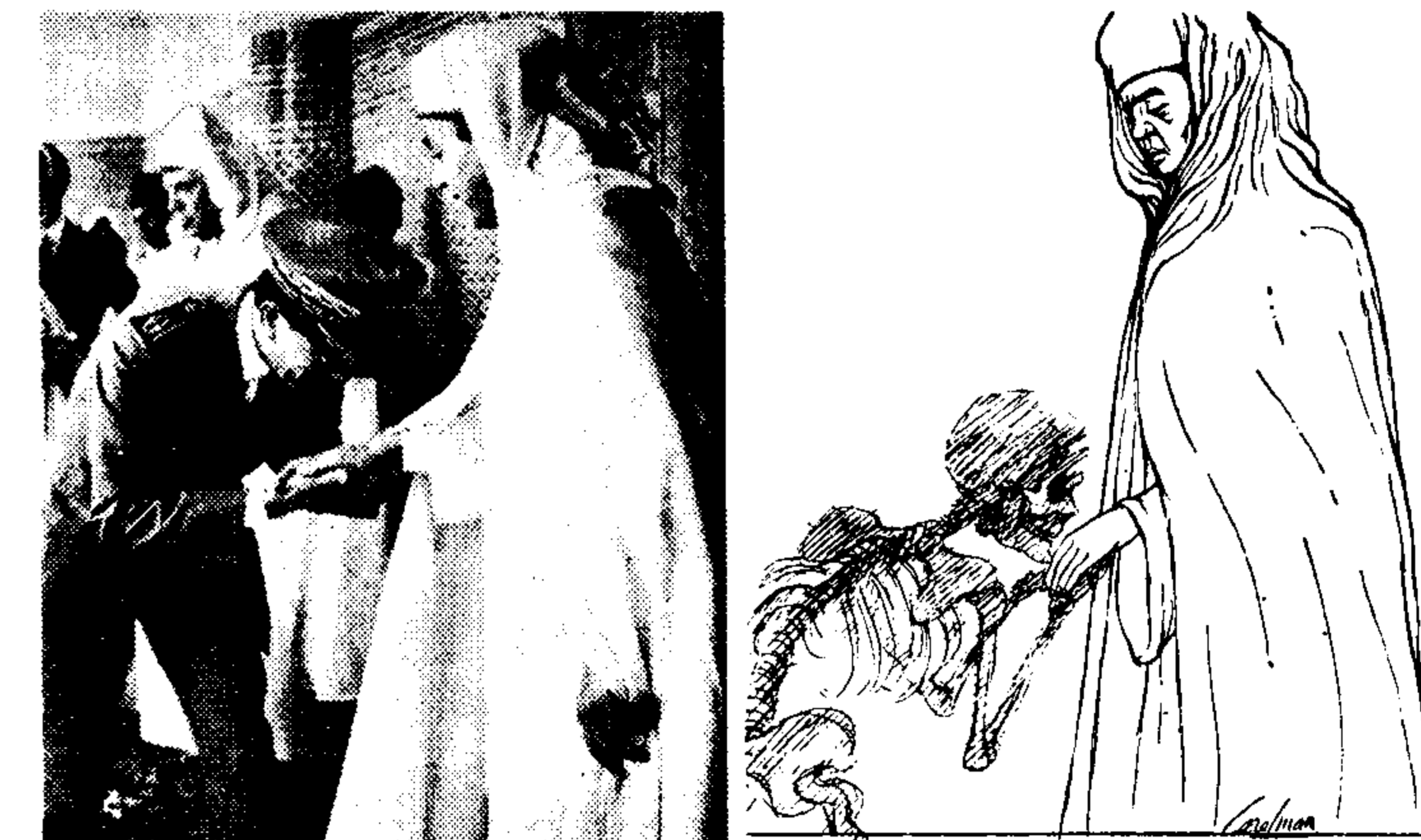
Θύμα ευθείας ή συνωμότης ο στρατηγός Ουφκίρ; Ο πιστός του βασιλέως...