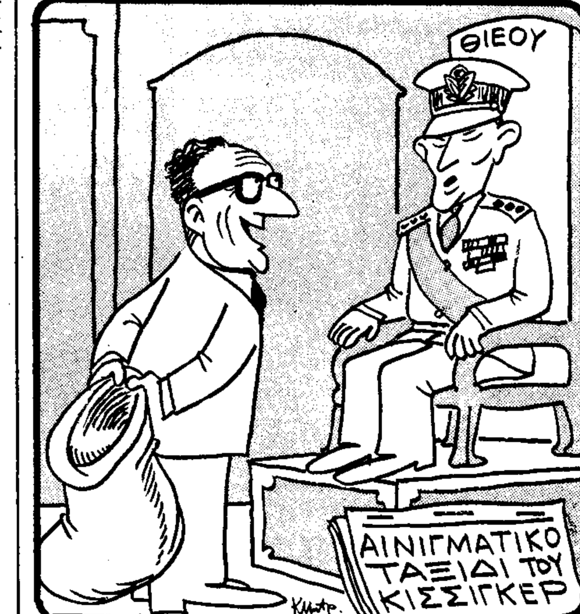
Αυτή είναι η γνώμη κατά πληροφορημένων κύκλων...